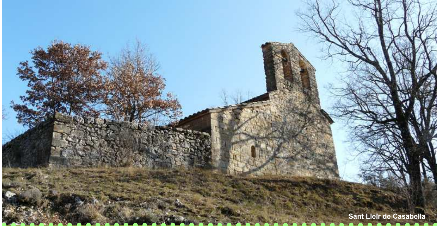
Sant Lleir de Casabella