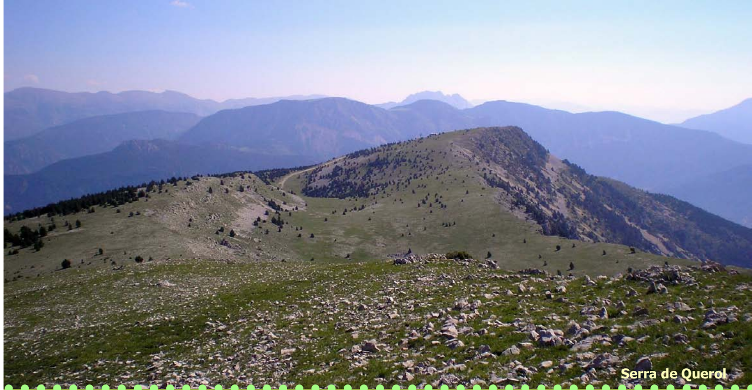
Serra de Querol