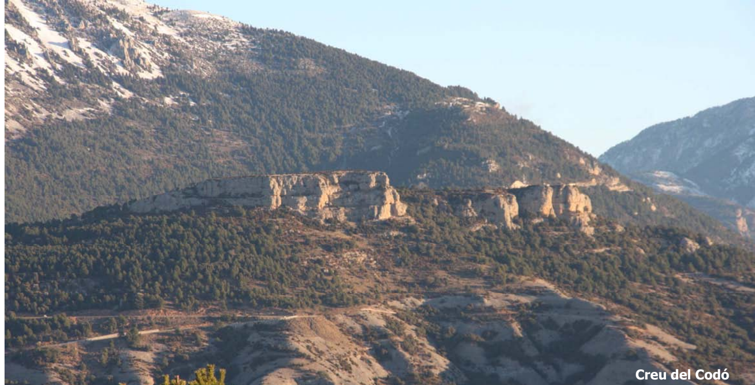
Creu del Codó