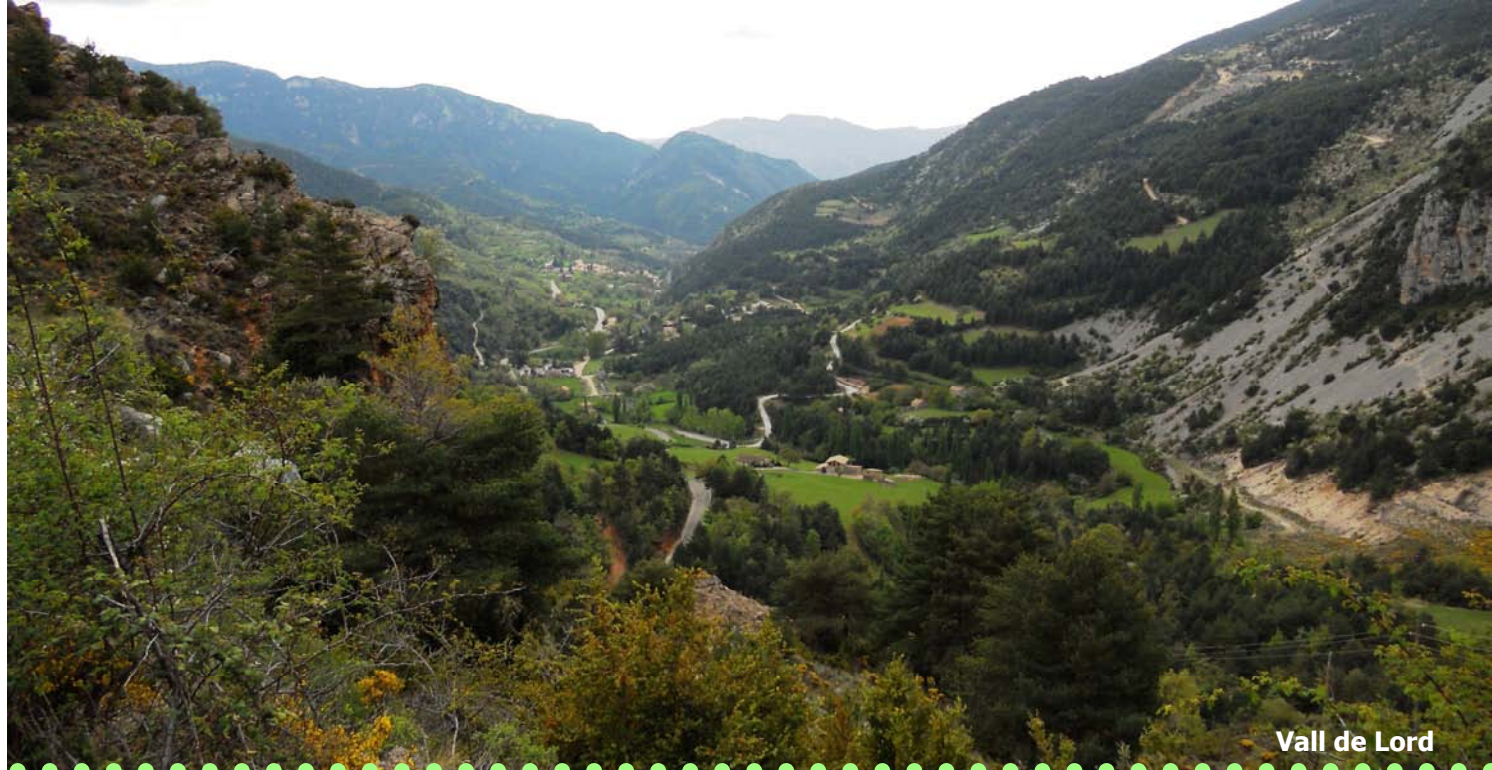
Vall de Lord