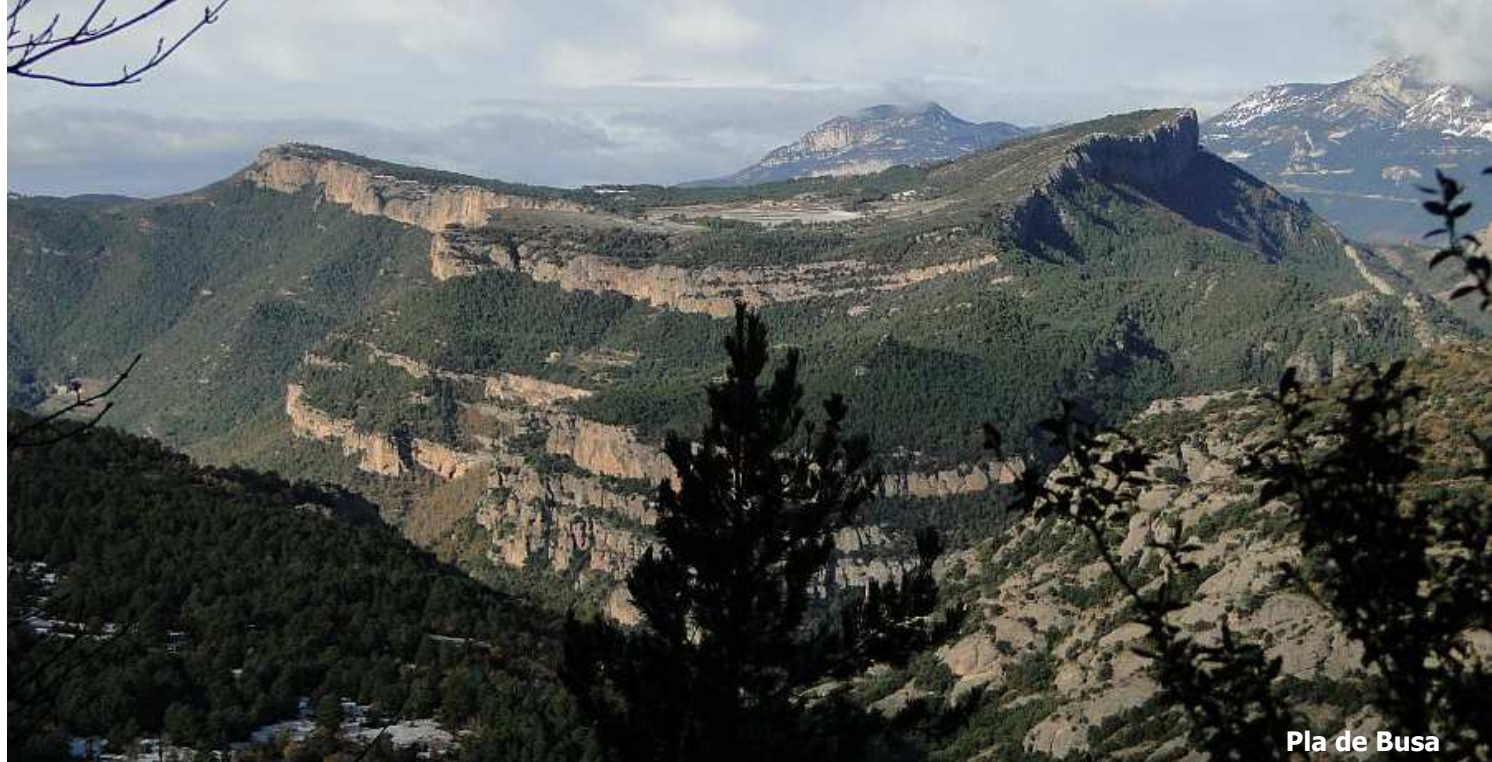
Pla de Busa